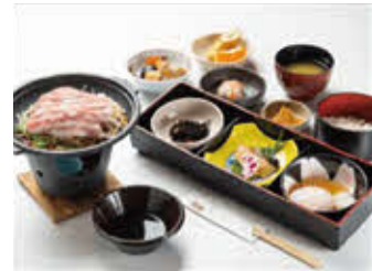
黒麴陶板蒸し しゃぶ御膳